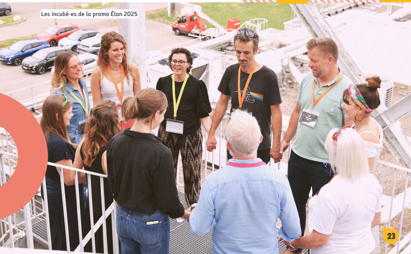
Les incubé-es de la promo Élan 2025

Il s'agira aussi de sécuriser l'emploi de certains salarié-es qui cumulent des temps partiels avec plusieurs employeurs en proposant un employeur unique.