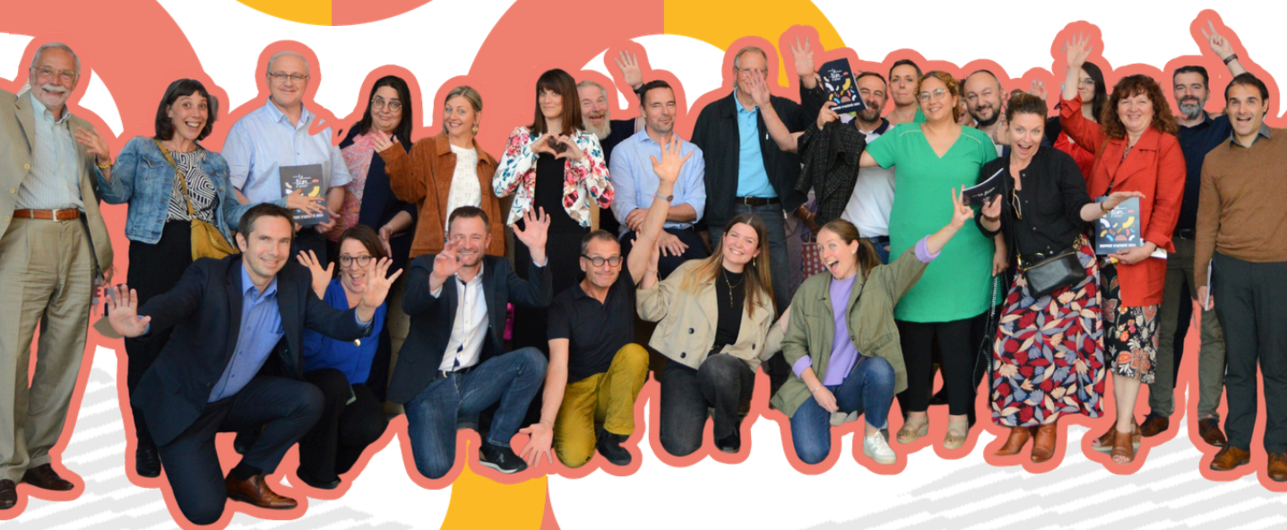
Assemblée générale du Filon

Entre stress, authenticité, solidarité et éclats de joie, nos incubé-es ont livré des présentations sincères et engagées qui ont profondément marqué le public. La soirée s’est conclue par la remise des prix du public à Elandza, Mudita et Les Meuhnieds. Une édition vibrante, à l’image de l’énergie collective qui anime l’écosystème de l’ESS en Moselle.