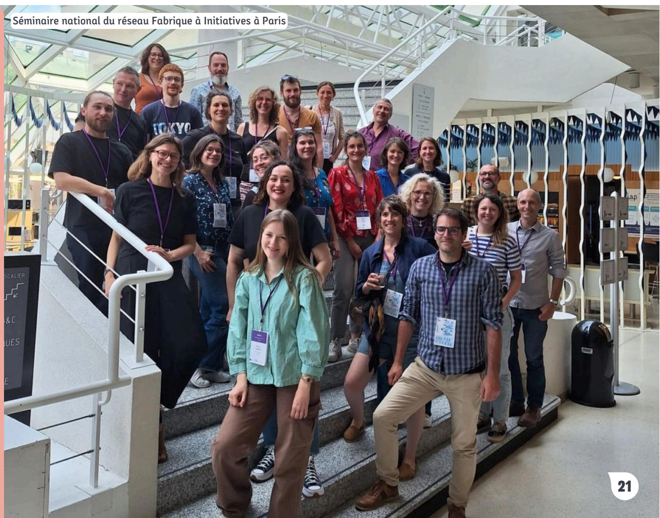
Séminaire national du réseau Fabrique à Initiatives à Paris

Une journée forte, collective et engagée , au service d'un enjeu essentiel : mieux protéger et accompagner les enfants et les familles du territoire.