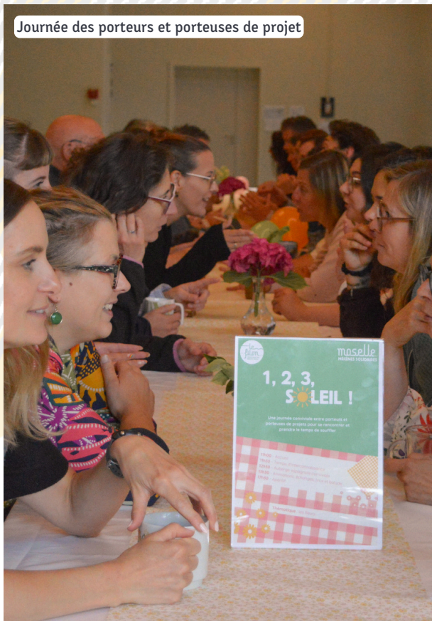
Journée des porteurs et porteuses de projet

De véritables temps conviviaux et de partage qui renforcent notre dynamique collective et le sentiment d'appartenance à l'aventure du Filon.